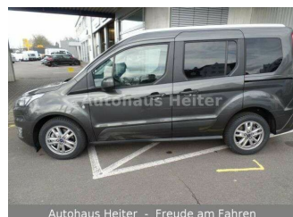
Autohaus Heiter - Freude am Fahren