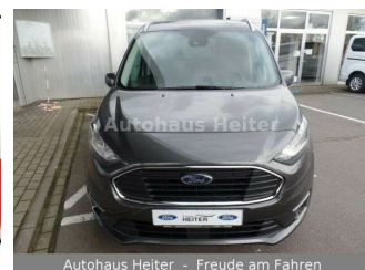
Autohaus Heiter - Freude am Fahren