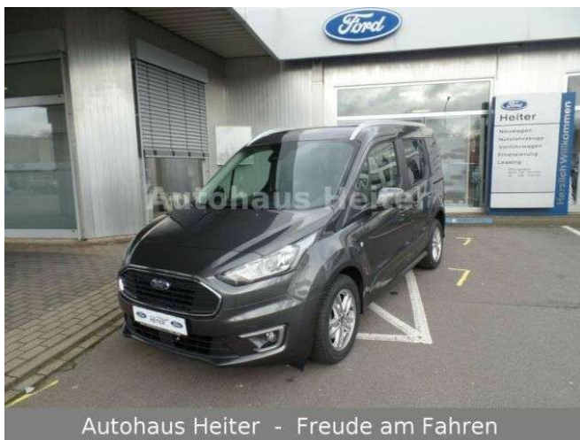
Autohaus Heiter - Freude am Fahren