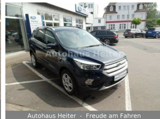
Autohaus Heiter - Freude am Fahren