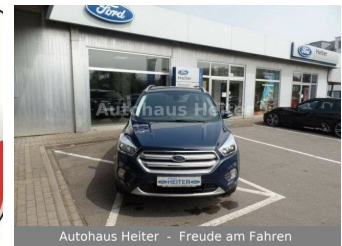
Autohaus Heiter - Freude am Fahren