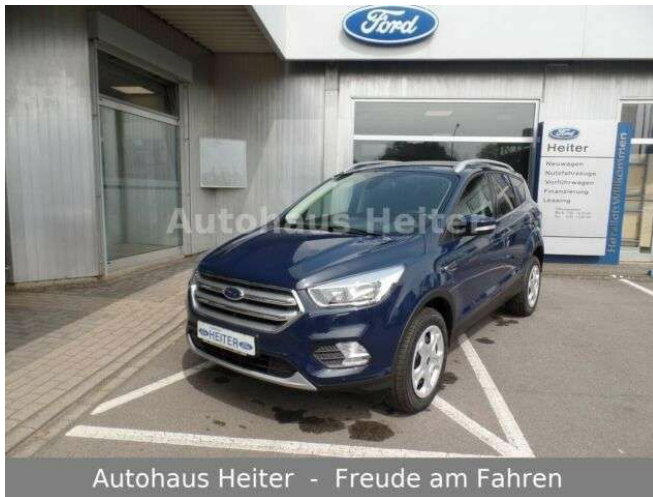
Autohaus Heiter - Freude am Fahren