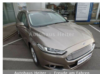
Autohaus Heiter – Freude am Fahren