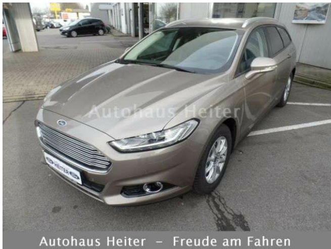
Autohaus Heiter – Freude am Fahren