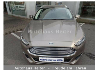
Autohaus Heiter – Freude am Fahren