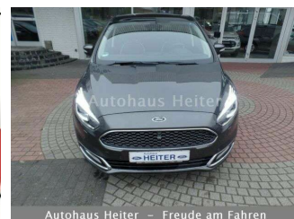
Autohaus Heiter – Freude am Fahren