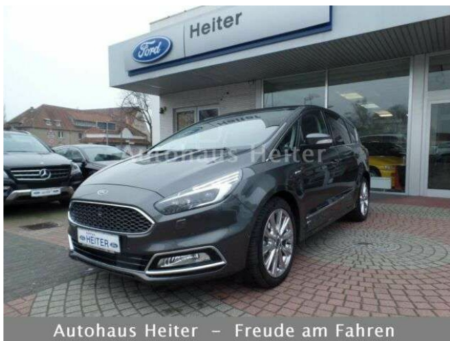
Autohaus Heiter – Freude am Fahren