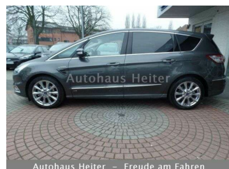
Autohaus Heiter – Freude am Fahren