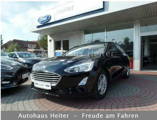
Autohaus Heiter – Freude am Fahren