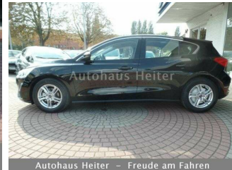
Autohaus Heiter – Freude am Fahren