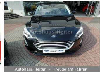
Autohaus Heiter – Freude am Fahren