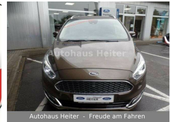
Autohaus Heiter - Freude am Fahren