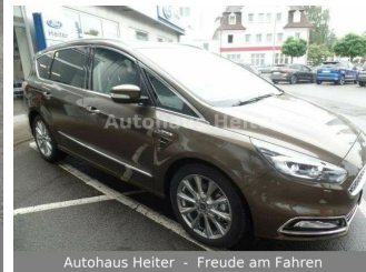
Autohaus Heiter - Freude am Fahren