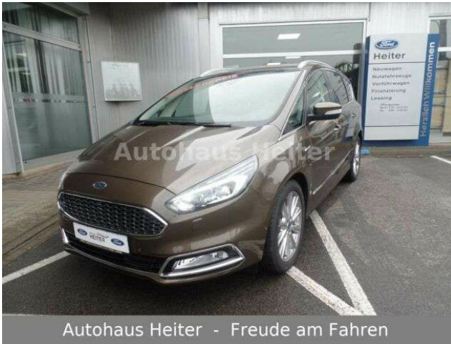
Autohaus Heiter - Freude am Fahren